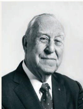
Джон Джърм, Президент, Ротари Интернешънъл