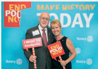
Джон Джърм, Президент, Ротари Интернешънъл